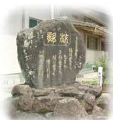
元正天皇御製 歌碑