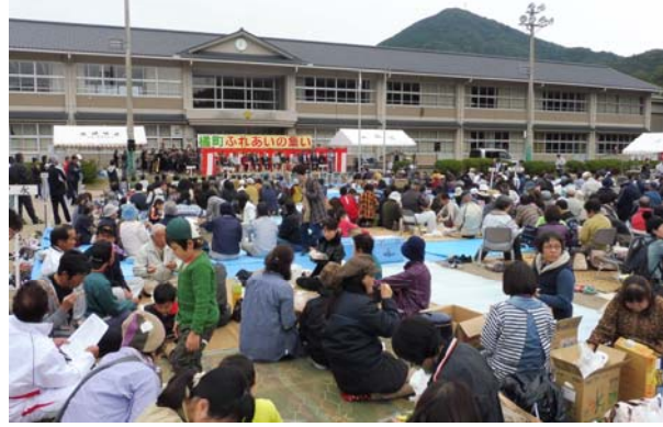
昨年のふれあいの集いの様子

9月9日(金) 運動会での演奏に向けた、各パートごとの練習です。リコーダーや鍵盤ハーモニカの練習では、上級生が下級生に音色やリズムについて、優しくアドバイスをしてくれます。下級生は緊張の中にも上達をめざして、しっかり練習に取り組