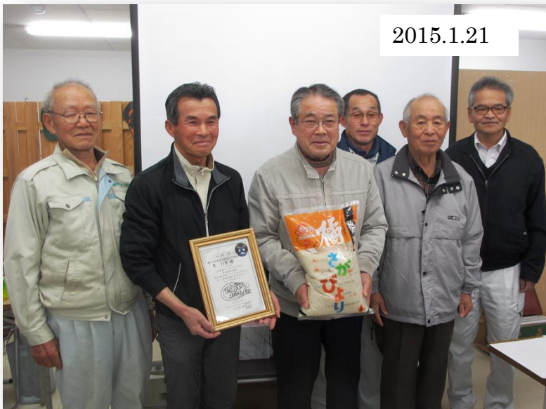
お米コンテスト金賞の賞状とともに地元マスコミの撮影に応じる生産者の代表（研修会前に撮影）

金賞受賞の栄誉におごることなく、橘生産者の「おいしいお米づくり」への追求は続きます！