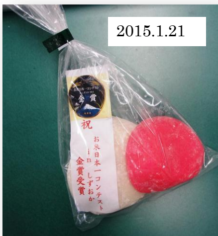
お米コンテスト金賞受賞を祝して、生産者に配られた紅白餅