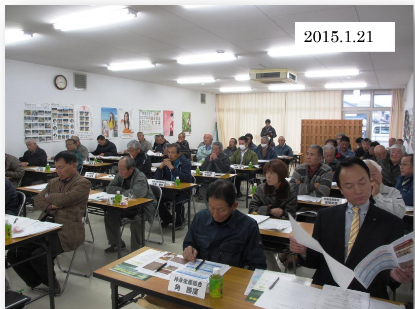
研修会に参加した橘町の実産者の皆さん