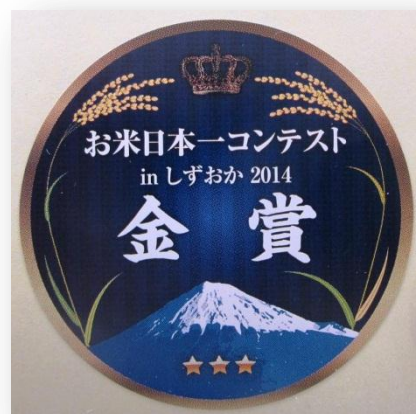
金賞受賞のシール