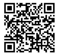
橋町のホームページ