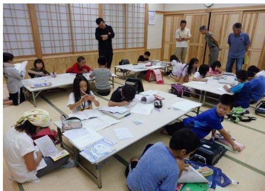
昨年度の通学合宿の様子(橋公民館)

して、いままの計画 行事や活動の計画 を、元気で活動し ながら、積極的に参 加して、楽しく活動 できるように、協 議会の計画 を、元気で活動し ながら、積極的に参 加して、楽しく活動 できるように、協 議会の計画