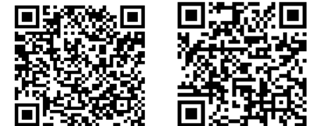
橋公民館ブログ 橋町のホームページ