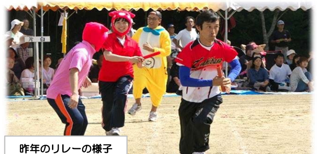
昨年のリレーの様子