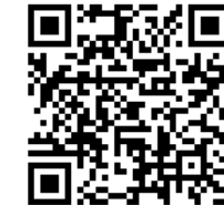
橋町のホームページ