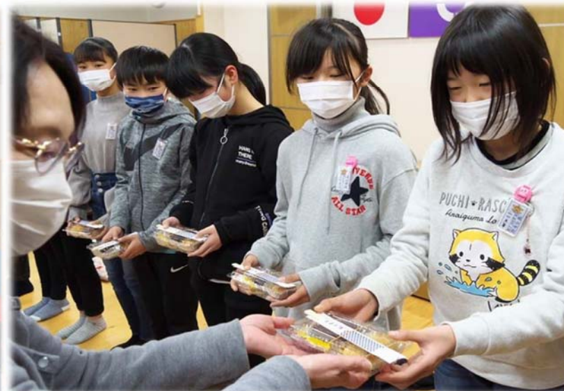
地域婦人会からぼたもちの贈呈