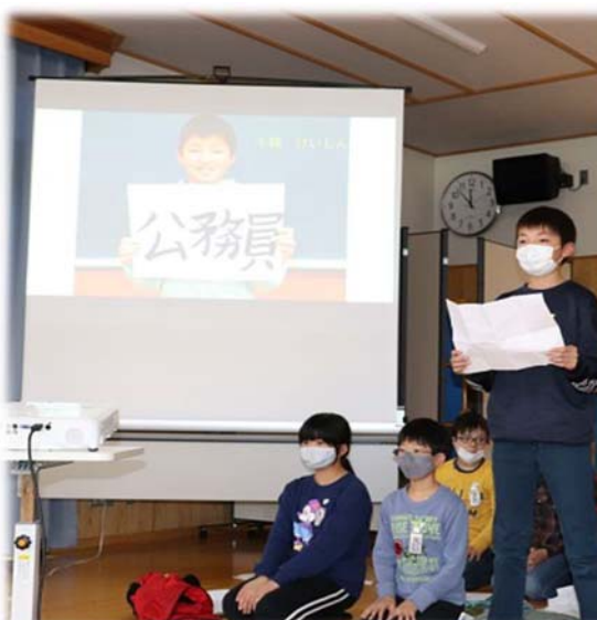
地域愛あふれる発表

卒業生を送る会では、「6年生の決意」について児童一人一人に発表してもらい、地域への愛情を十分に感じ取ることができました。中学生になっても、頑張ってもらいたいですね！