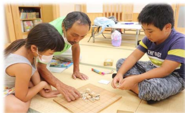
地域の方から山崩しを教えてください