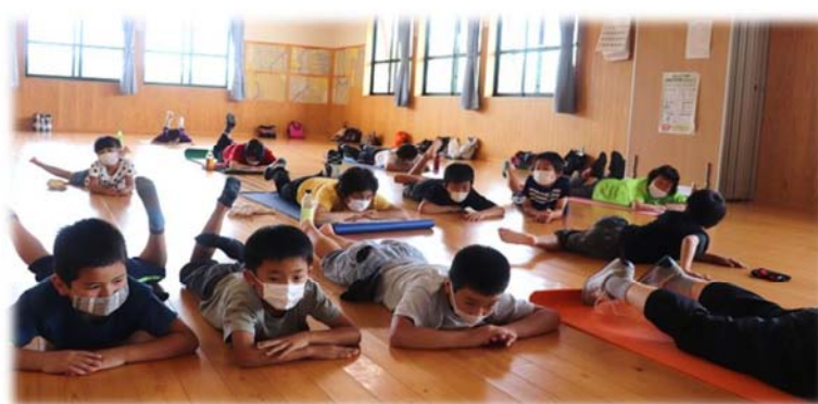
公民館サークルを体験