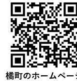
橋町のホームページ