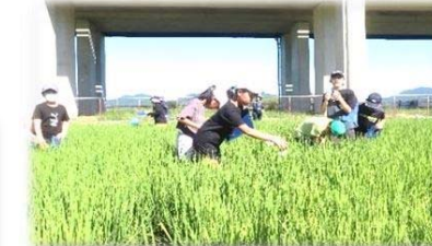
田んぼの学校・田んぼの生き物調べの様子