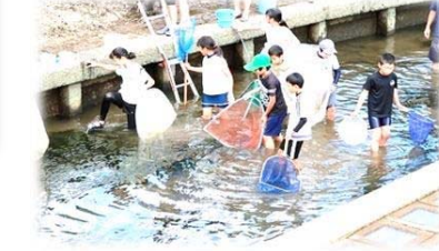
田んぼの学校・川の生き物調べの様子